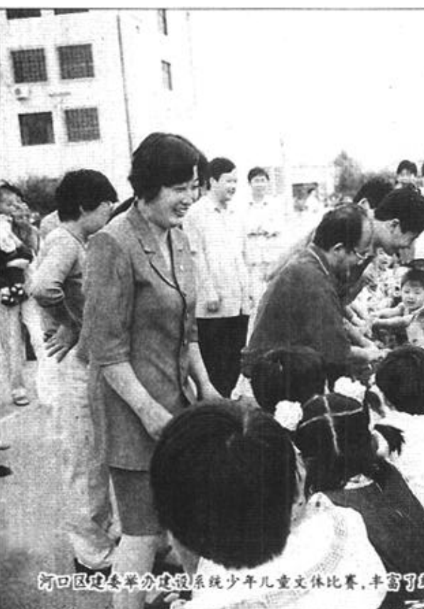
河口区建委举办建设系统少年儿童文体比赛，丰富了少年儿童文化生活。

一块块棉田大方里，县农业局副局长刘增楠说：“尽管今年干旱时间长，虫害多，但经过大家的不懈努力，棉花单产可达68.7公斤/亩(皮棉)，比去年增长8%，全县9.8万亩棉田，预计总产可达6450吨，与去年同比增长11%，仅此一项全县农民人均可增收100余元。