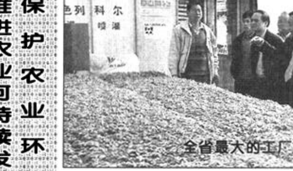
全省最大的工厂化育苗中心

建市以来，市委、市政府十分重视我市检疫工作的开展，给予了大力支持，使我市检疫工作得到了健康发展。一是认真搞好产地检疫，把危险性病虫害消灭在初发阶段。二是严格控制种苗生产与经营。对全市种苗生产、经营单位进行了详细的资格审查，并为260家单位办理了《植物检疫登记证》。三是切实加强调运检疫，有效地控制疫情传播蔓延。常年检疫调运产品2万吨。四是成功地将控制稻象甲的扩展蔓延。将稻象甲控制在东营范围内，成为我国稻象甲的南大门，保护了鲁南地区和江南稻区农业生产安全。