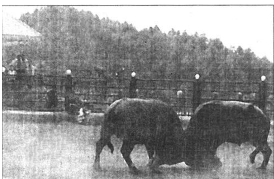
在贵州省红枫湖风景区，游人们既可以领略到秀丽的自然风光和独特的民族风情，还可以欣赏到激烈的“斗牛”、“斗马”比赛。图为激烈的“斗牛”场景。

大力开发新技术、新产品、新工艺，不断提高行业技术水平，提高产业集约化程度，初步转变了粗放型增长方式。农业大力发展优质品种，调整作物、畜禽和水产品的品种结构，发展节水灌溉、旱作农业和绿色农业；铁路交通持续推广提速技术；机械行业努力发展专用设备、数控、成套机床等等，通过高技术对传统产业的改造和渗透，有效提高了传统产业的技术水平和竞争能力。高技术产业在对传统产业进行改造和渗透的同时，常常又开发出许多新的高技术及其产品，如自动化控制系统、数控系统等，为传统产业在更高层次上的发展开辟广阔道路。