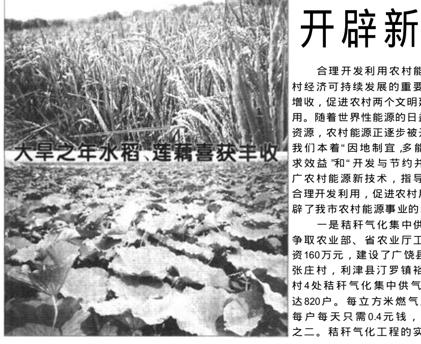
大旱之年水稻、莲藕喜丰收

我市自1996年以来实施农作物良种工程。一是引进“高精尖”品种，追求生产高附加值，累计建立引种试验基地171.5亩，引进农作物品种466个，筛选出苗头品种38个，已应用推广品种27个。二是根据良种繁育基地建设进一步完善，集良种繁育、生产、推广于一体。三是统一供种实现历史性突破。通过采取典型带动、政策扶持、利益诱导、农民自愿、梯次推进的措施，大幅度提高了良种供应保障率，品种布局日趋合理。