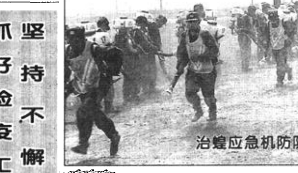
治蝗应急机队紧急出击

结合生态示范农场模式；五是农村能源再生利用模式；六是节水灌溉模式；七是城市污水净化再利用模式；八是以水产养殖为主的复合型生态农业模式；九是“上农下渔”模式；十是渗水养虾模式；十一是农林（果）立体型种植模式；十二是种桑——养蚕模式。通过上述模式的推广，1999年，全市生态农业控制面积达到了120万亩，农作物复种指数达到了170%，大大地提高了土地生产率。