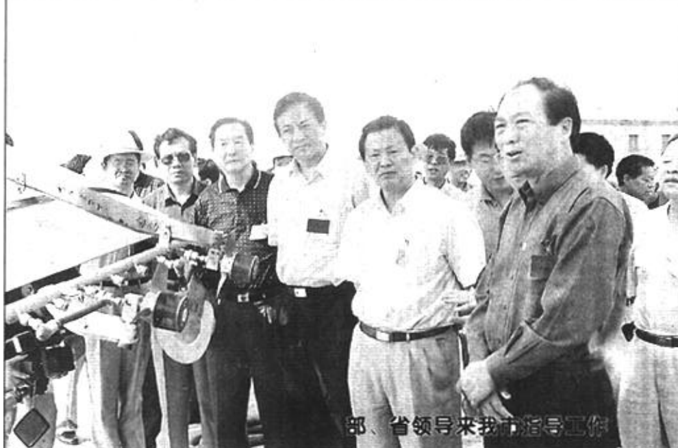
部、省领导来我市指导

二是农村集体财务管理迈向民主化、公开化和电算化。农村集体财务管理工作是各级党委、政府和广大农民群众普遍关注的热点，也是引发党群干群关系矛盾的焦点。1998年，市委、市政府在全市组织开展了财务公开和民主理财工作。全市的农村集体财务管理工作做到了“四统一”：一是统一了公开的时间、形式和内容；二是统一了民主理财程序；三是统一了帐簿设置和财务档案管理；四是统一了对村会计管理。针对农村集体财务“双代管”工作量大、实际，市农业局从1999年开始在符合条件的乡镇推行了农村集体财务电算化管理办法。目前，全市已有8个乡镇实行了电算化管理办法。