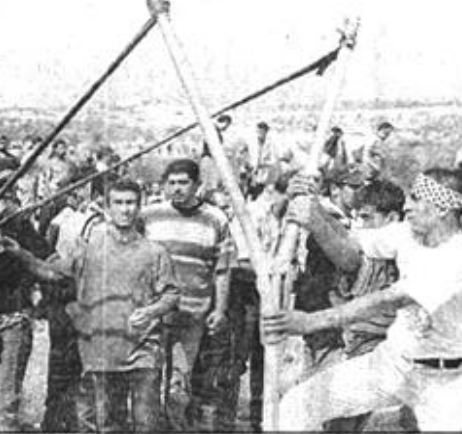
10月7日，以色列军队与巴勒斯坦人在黎以边界发生冲突。以军开枪打死两名示威的巴勒斯坦人，另有15人受伤。黎巴嫩真主党声明绑架了3名以色列士兵。这是巴勒斯坦示威者在冲突中使用一个巨型弹弓。

据日本气象厅观测，此次地震震级为里氏7.1级，震源在鸟取县西部，震源深度为10公里，四国和近畿地区都有强烈震感。地震还导致5幢民宅倒塌，9000多人家断电。